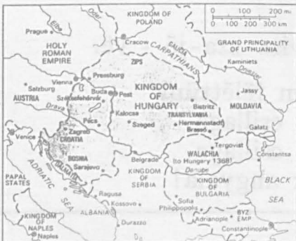
Hungary in 1360

Adapted from R. Trehan and H. Fullard (eds.), Map's Historical Atlas: Ancient, Medieval and Modern , 9th ed. (1962), George Philip & Son Ltd, London.