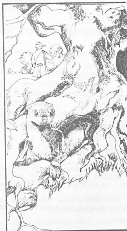
(Lutra. Szecskó Péter illusztr.)

Írásainak sajátos varázsát a természetközelség adja meg, a meseszöveg frissessége és eleven bája, amellyel minden élőlényt az emberi világ részesévé tesz. Fekete István 1970. június 23-án hunyt el.