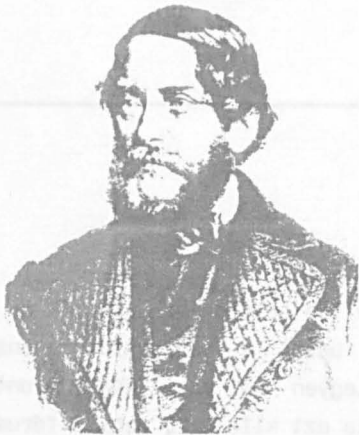
Kossuth, lithograph, 1856

hogy egy jó enciklopédia a tájékozódni vágyó ember számára aranyat ér. Könyvtárunk is ezért vásárolta meg az 1989-es kiadású 33 kötetes Encyclopaedia Britannica -t, amely tartalmában egyedülálló, korrekt adatokat