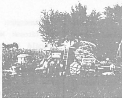
Threshing grain near Kecskemét, Hung.

Kecskemét , town and seat, Bács-Kiskun megye (county), central Hungary. Long established as a centre for handicrafts and cattle rearing, it has also grown in importance for its viticulture, vegetables, and fruit. It is surrounded by flat sandy farmland, often referred to as "the orchard of Hungary," providing about 25 percent of the country's fruit, notably apricots, and producing preserves, syrups, and