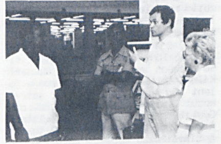
Válogatás az új könyvtár vendégkönyvének beírásaiból és a látogatások, rendezvények képeiből.