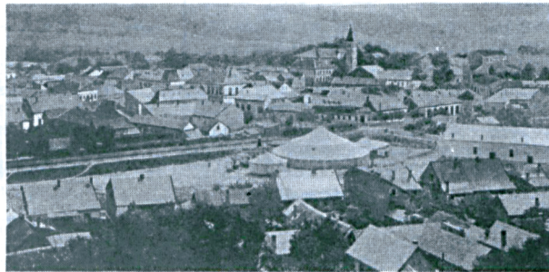
Salgótarján, Látkép Kiad. Dr. Német Dezsőné 1921

HÍRMONDÓNK e számától kezdődően bemutatunk néhány régebbi, Salgótarjánt ábrázoló képes levelezőlapot.