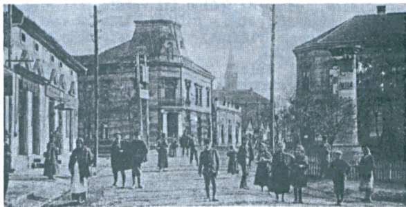
Salgótarján, Fő-utcai részlet Kiad.: Révay Sándor St. 1926

A közel nyolcszáz darabot számláló képeslaptárban sok szép felvétel található Nógrád megye településeiről, tájairól. Képeslapjaink között vannak a század első évtizedeiben, a közelebbi múltban és napjainkban készült lapok. Az érdeklődő, búvárkodó olvasó egymás mellett találhatja az egy-egy település régi és új arcát bemutató felvételeket. A lapok segítségével nyomon követhető szűkebb hazánk, Nógrád megye, a községek, városok fejlődése, gyarapodása, változása.