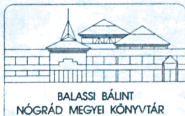
BALASSI BÁLINT NÓGRÁD MEGYEI KÖNYVTÁR

MELLÉKÁLLOMÁSOK Általános tájékoztatás 33 Kölcsönzési nyilvántartás 28 Szaktájékoztatás 25 Gyermekkönyvtár 32 Városi módszertan 20