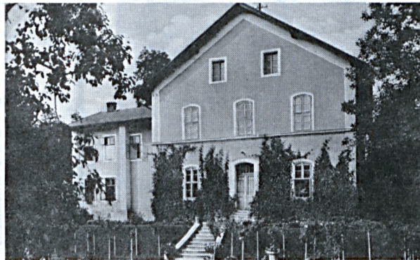
Rimamurány - Salgótarján vasmű RT. Gyárigazgatói lakás (1930)