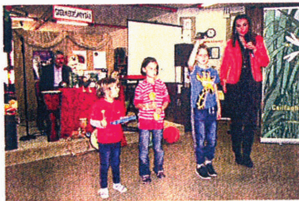
A legkisebbek is jól érezték magukat a Balassi Bálint Megyei Könyvtár rendezvényein