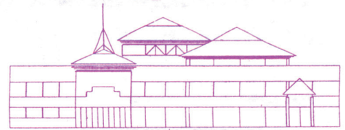
Balassi Bálint Könyvtár