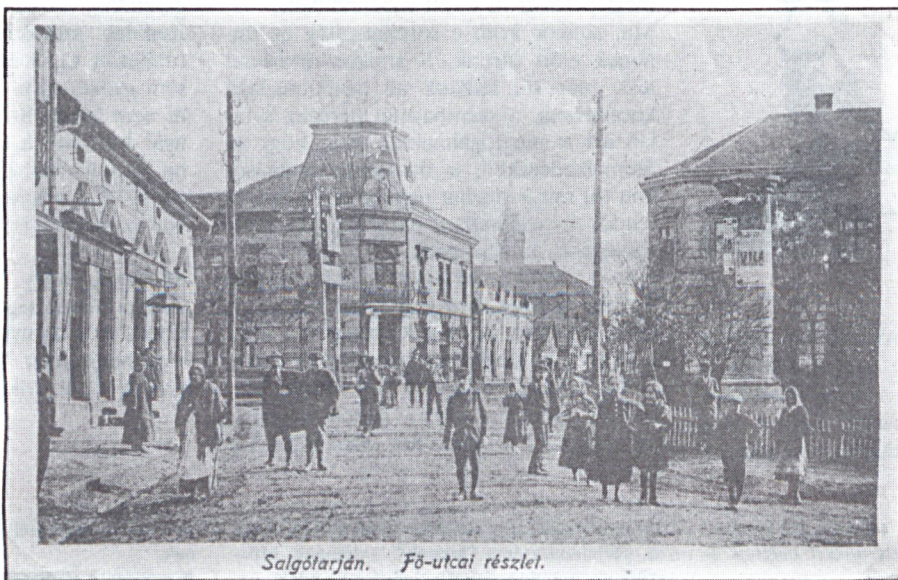
Kiad.: Révay Sándor St. 1926.