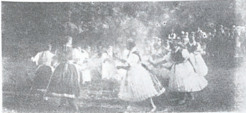
Szentiván-napi tűzgrás (Kazár, Nógrád megye)

Már a 18. században feljegyezték, hogy a szentiváni tüzet a lányok átugrálják. Ilyenkor a fiúk figyelik, hogy milyen ügyesen mozognak ugrás közben a lányok.