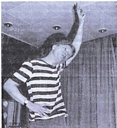
Hegedűs D. Géza: Viszockij (Balassi Pódium)