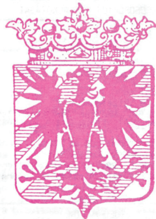
1941. Címerjavaslat (nem engedélyezték)