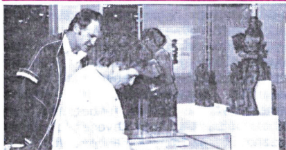
A Balassi Bálint Asztaltársaság alkotó tagjainak kiállításának fotója