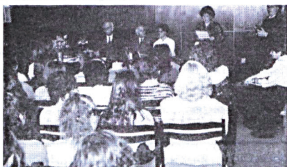
Balogh Béni: Omló bástyákon hulló csillagok c. könyvének sajtóbemutatója