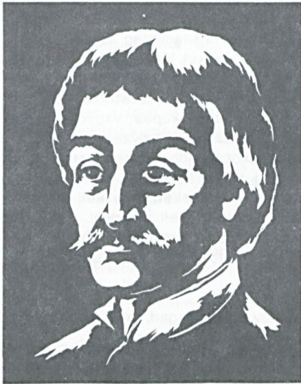
BALASSI BÁLINT 1554–1594

[ELOGIUMOK A TEKINTETES ÉS NAGYSÁGOS GYARMATI BALASSA BÁLINT ÚRNAK, AZ IGEN TUDÓS KATONÁNAK ÉS KÖLTŐNEK]