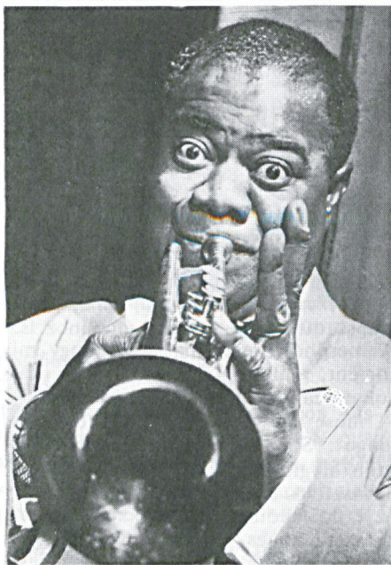
LOUIS DANIEL "SATCHMO" ARMSTRONG TROMBITA

"Nem szeretem a zenémről szóló vitákat. A swing és a jazz egész életemben ugyanazt jelentette számomra. A régi jó időkben - 1900 körül - ragtime zenének nevezték, később használatos lett a jazz, hot-zene, meg a "gutbucket" kifejezés. Most ugyanezt egy kis mázzal bevonva swing-zenének hívjuk. Forgathatjuk akárhogy is, még mindig ugyanarról a zenéről van szó. Ha valakit érdekel: az ember minden témában játszhat szólót, s azt nevezheti jazznak vagy swingnek."