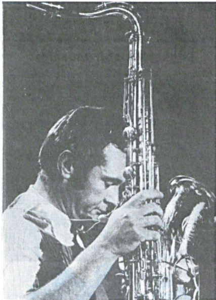
STAN GETZ (szaxofon)

Izgalmas "pillanat" a jazz történetében. Fehér muzsikusi, 4 évtizedes pályafutás, egyedi hangvétel, példakép még azoknak is, akik mosolyogva fogadtak minden olyan próbálkozást, ami nem New Orleans-ból vagy Chicagóból indult. Getz hangzásának bársonysímasága, az általa kialakított lebegő effektus népszerűvé tette mind a klasszikus, mind az avantgarde hallgatóságánál. A felszín alatt égető töltések rejtőznek, s csak alkalmilag törnek fel. Rövid európai látogatása után új elgondolásokkal tér vissza az Egyesült Államokba. Kiterjedt figyelemmel fordul a brazil és más latin-amerikai zenei formák felé. Ennek eredményeképpen számos latin lemezt készített, amelyek rendkívül népszerűek lettek, közöttük a "The Girl from Ipanema", innentől jegyezzük a jazzben a bossa-nova divatot. A legkisebb "művészi engedelmény" nélkül talált meg egy olyan közérthető dallamvilágot, mely óriási lépést tett lehetővé a műfaj közérthetővé tételében. Mérföldkőnek számító albuma, a "Jazz Samba" (1962) megtalálható könyvtárunk zenei részlegében.