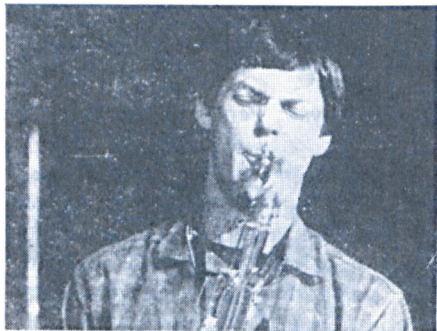
JAN GARBAREK (Szaxofon)

A "legjobb" pillanatban érkezik a jazz világába. A norvég fiatalember John Coltrontól hallgat rádió, s oly nagy hatással van rá, hogy minden iskolai segítség nélkül megtanul szaxofonozni.