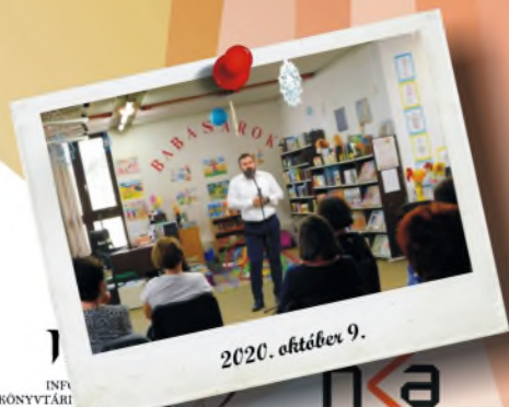
2020. október 9.