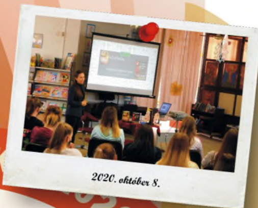
2020. október 8.