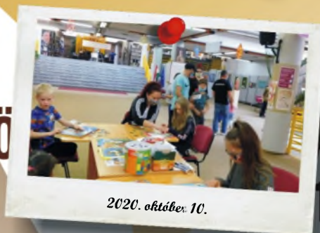
2020. október 10.