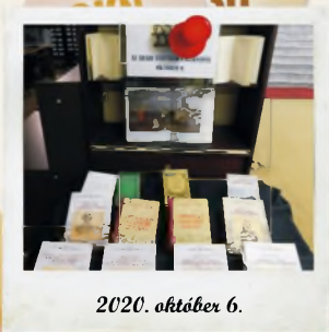
2020. október 6.