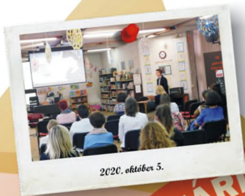
2020. október 5.