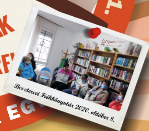
Besztercei Fiókkönyvtár 2020. október 8.