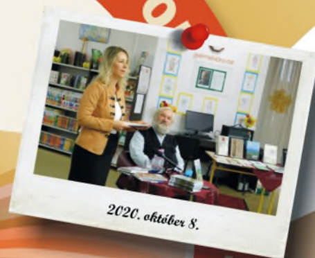
2020. október 8.