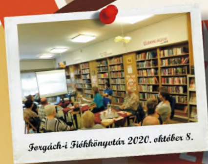
Forgách-i Fiókkönyvtár 2020. október 8.