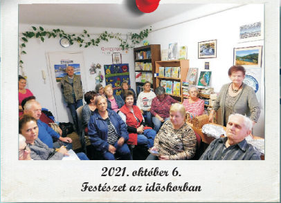
2021. október 6. Festészet az időskorban