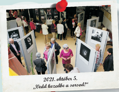
2021. október 5. „Vedd kezébe a sorsod!”