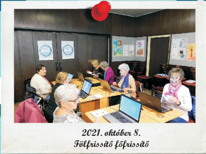
2021. október 8. Félfülsztő főfűrsztő