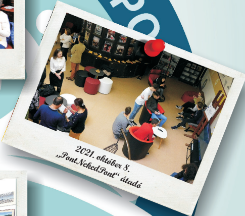
2021. október 8. „Pont, Neked, Pont” átadá