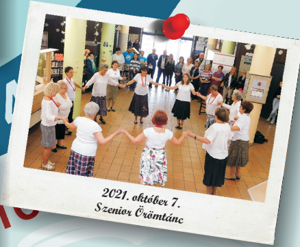
2021. október 7. Szenior Örmántánc