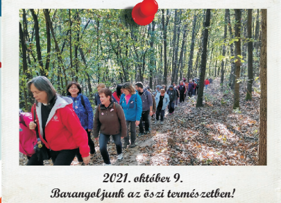
2021. október 9. Barangoljunk az őszi természetben!