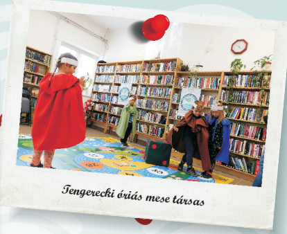
Tengerecki óvás mese társas