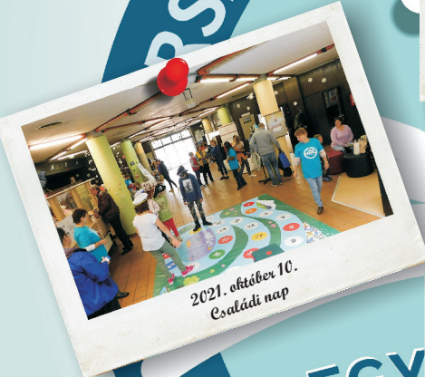
2021. október 10. Családi nap